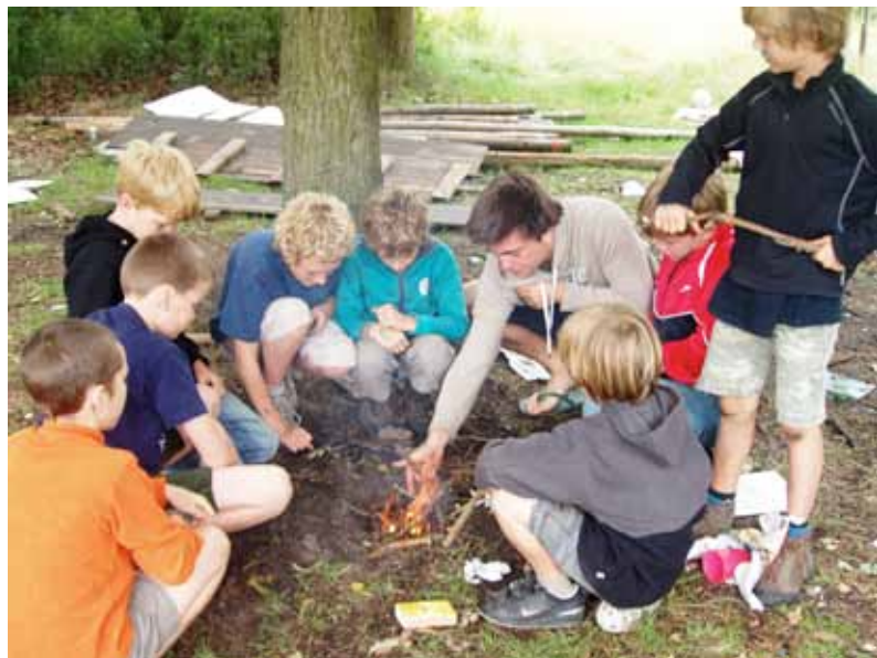
Ridderkamp welpen - 2011